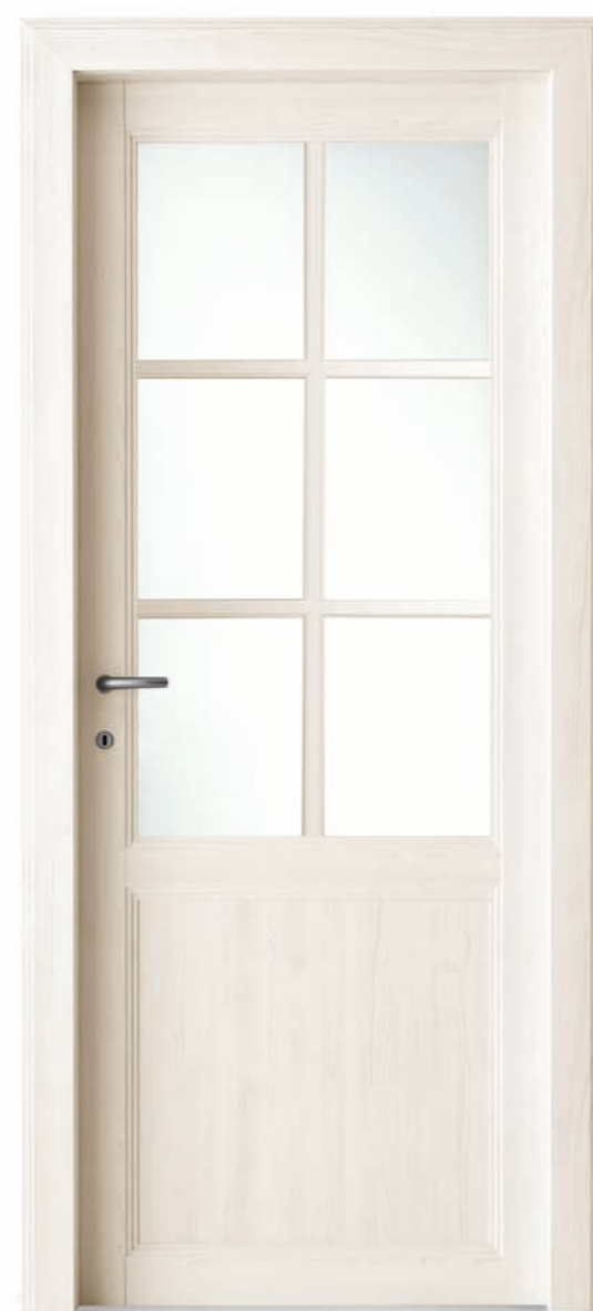
Olmo sbiancato Bleached elm