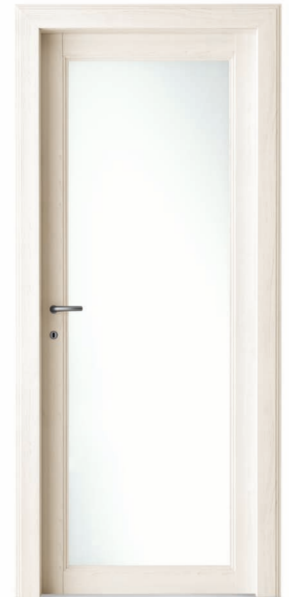
Olmo sbiancato Bleached elm