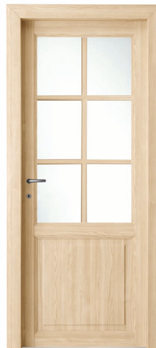
Olmo chiaro Light elm