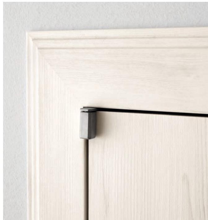
LATO INTERNO Internal side

TELAIO CASSA In listellare di abete e mdf rivestito in polimerico nelle finiture del bianco, olmo sbiancato, olmo chiaro e olmo tabacco e corredato da guarnizione di battuta a memoria meccanica. Predisposto per reversibilità di apertura.