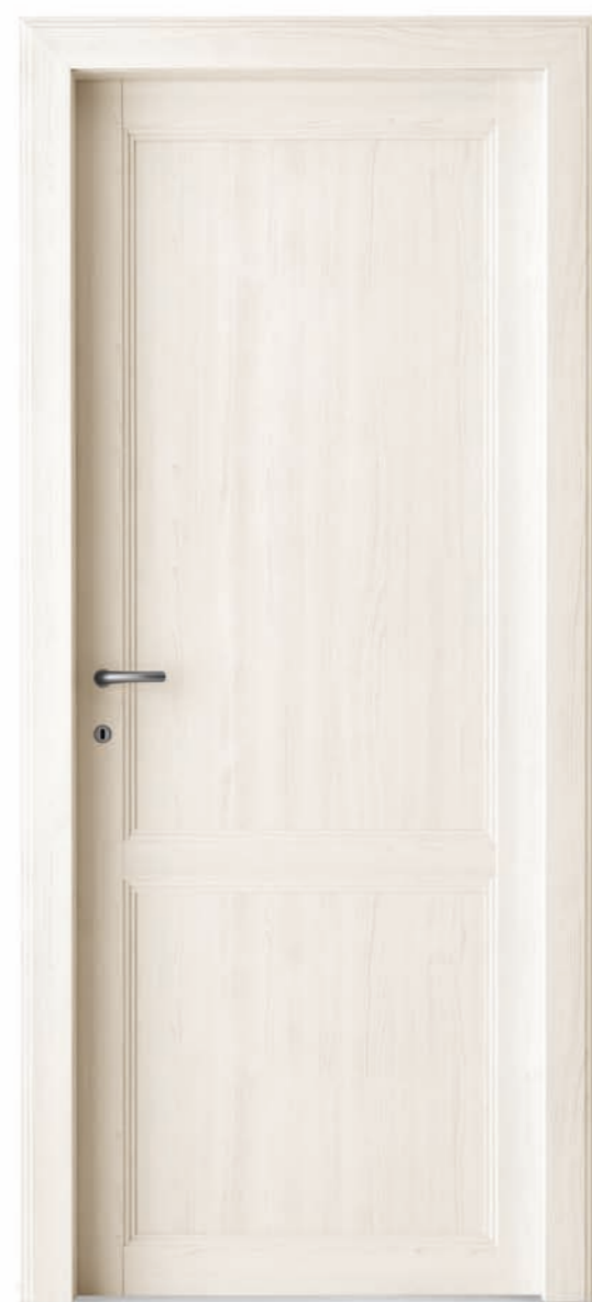
Olmo sbiancato Bleached elm