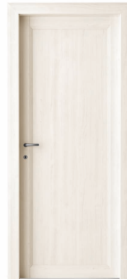
Olmo sbiancato Bleached elm