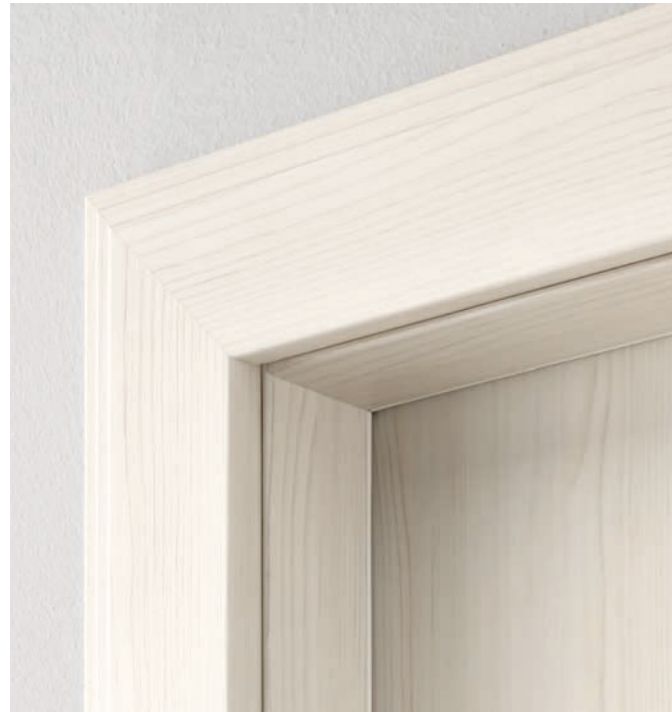
LATO ESTERNO External side