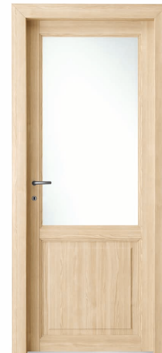
Olmo chiaro Light elm